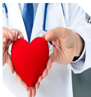
「急性心疾患」（心筋梗塞等） 「細菌性食中毒」「急性脳疾患」 「急性呼吸器疾患」