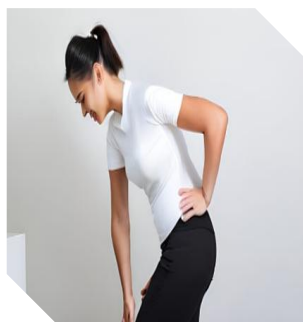
「運動中のケガ」 「クラブへの往復途上での事故」

クラブマネージャーの皆様の声から生まれた、皆様のクラブを守るための保険です スポーツクラブ参加者を突然襲う事故・疾病の例