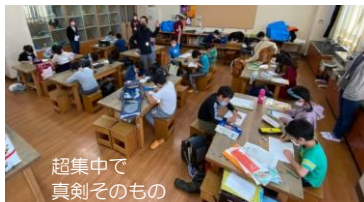
超集中で 真剣そのもの

宿題ではないので、プリントをやるかやらないかは自由。不公平の無い様に各自持ち帰り制にしてみました。もっとやりたい児童や、やらない児童など、いろんな児童がいました。遊びプリントは大人気！