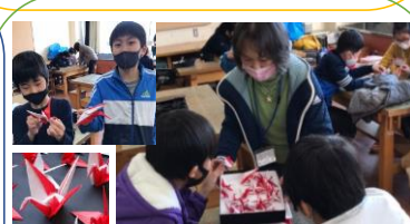
折り紙でお馴染みの『鶴』

紅白で仕上げる折り方講座など、寺子屋先生に教えてもらいながら楽しそうに鶴を折っていました。今年度最終日は、震災時に役立つ『新聞スリッパ』を作りました。